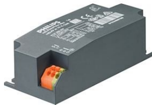
HID-PV m 50/S