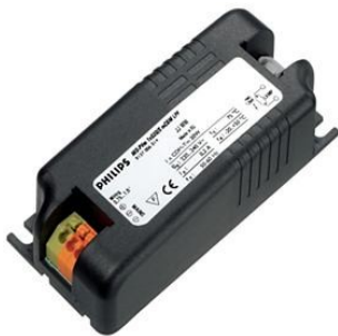
HID-PV m 35/S